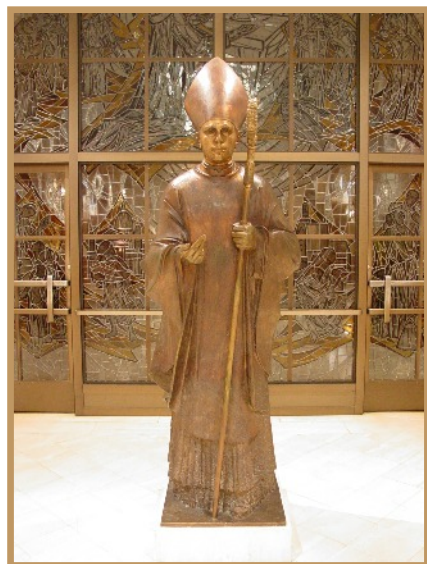
Socha sv. Jana Nepomuckého Neumanna v kapli Panny Marie Hostýnské ve Washingtonu, D.C.

Ďalším je nám tu v USA dobre známy sv. Jan Nepomuk Neumann , ktorý bol biskupom vo Philadelphii.