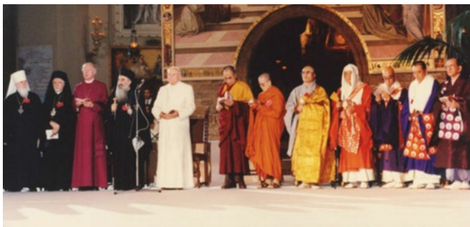
Setkání představitelů světových náboženství v Assisi 1986

Hinduisté vyznávají reinkarnaci. Do jaké podoby se člověk převtělí, závisí na jeho minulých činech (karma). Křesťané vyznávají jenom jednu „reinkarnaci“ a ta také závisí na jeho minulých činech. Náš život je Bohu velmi drahý, a proto se snažíme naplnit ho dobrými činy.