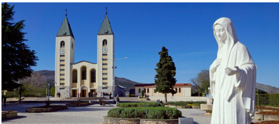
poutní místo Medjugorie - bývalá Jugoslávie, dnes stát Bosna a Hercegovina

A za třetí, pravým a vlastním jádrem této zprávy je duchovní rozměr, pastorační rozměr. Lidé tam přicházejí a obracejí se, setkávají se s Bohem, který mění život... Na to neexistuje nějaká kouzelná hůlka a tento duchovně-pastorační rozměr je nepopíratelný. Aby se nyní věci prohlédly se všemi těmito údaji – včetně odpovědí, které mi zaslali teologové – byl jmenován zmíněný biskup, který je velmi dobrý a zkušený, aby se podíval, jak je tomu s pastorační stránkou věci. A nakonec bude řečeno nějaké slovo.“