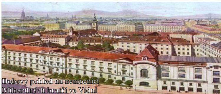
Dobový pohľad na nemocnici Milosrdných bratří ve Vídni

ohľadu na to, že nemali zdravotné poistenie. Vtedy mi to pomohlo a som im za to vďačný.